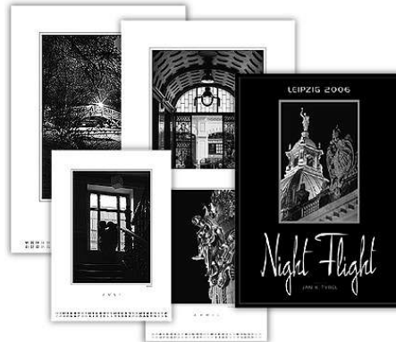
Abb. Ausgabe 2006 des Kalenders Produkt ab 1.6.09.2005 verfügbar. Alle Motive 2006: www.kalender-leipzig.de